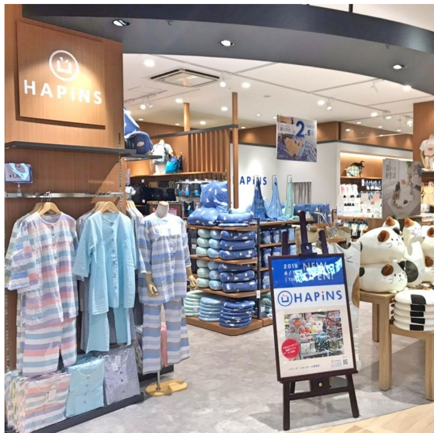
2019年4月16日OPEN イオンモール東浦店