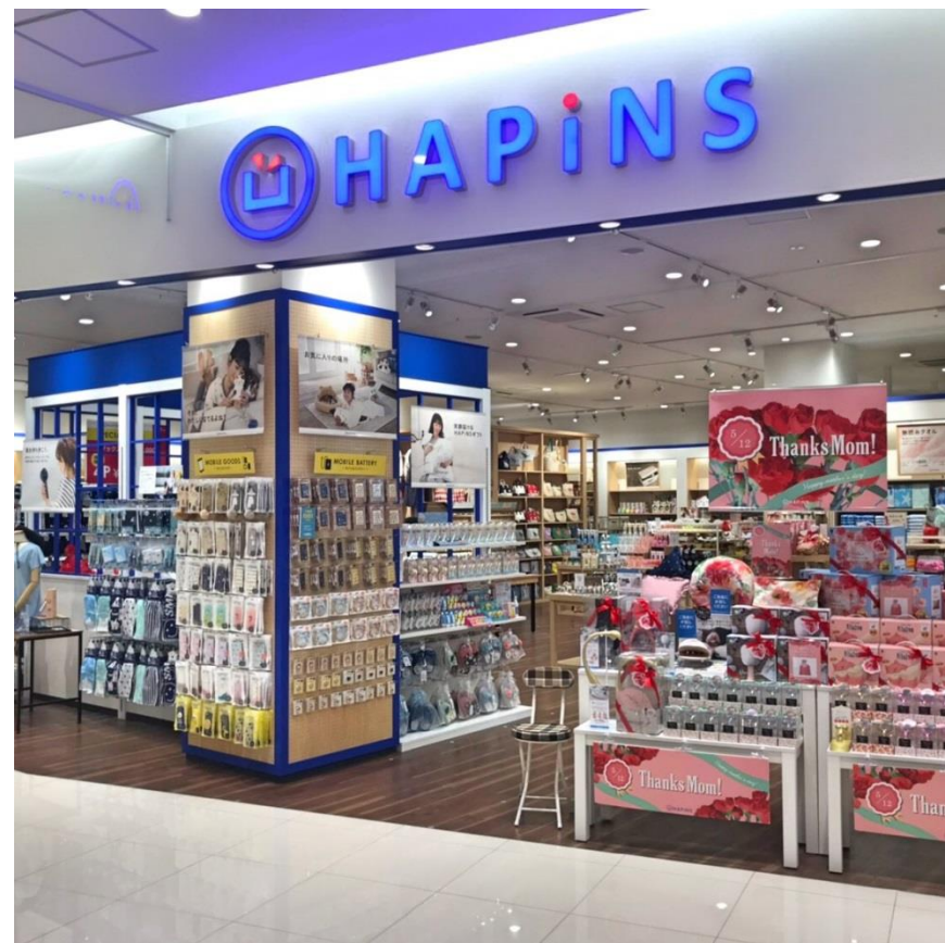
2019年4月25日OPEN カナートモール和泉府中店