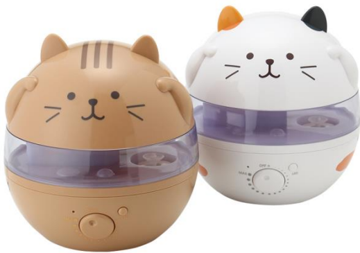
オリジナル加湿器