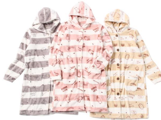
ルームジャケット